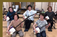
中津三線愛好会・三味線和会