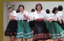
フォークダンス紅梅会