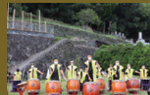
オーロラ源星中津太鼓